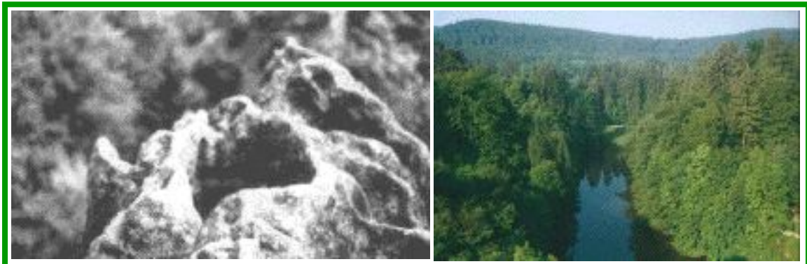
Socle de l’antique Irmisul au sommet & Petit Lac des Visées Nocturnes