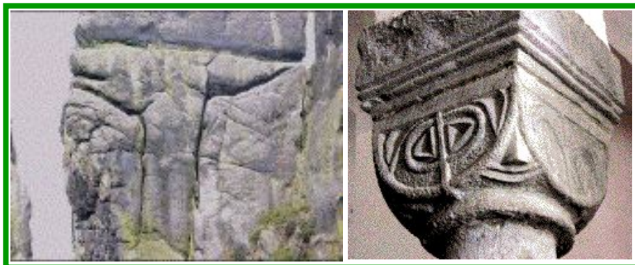
Irminsul naturel : “Hirchkuhe” avec peut-être la Rune du Don des Dieux* X & un des chapiteaux les plus signifiant de l’église (à gauche : Ouroboros * enserrant la Rune Dag, à droite : l’Irminsul debout)

qui portent tous des symboles extraordinaires.