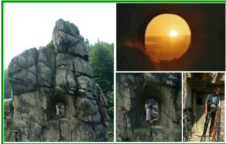
Sternwarte, vue ext. & int. & Lever de Soleil solsticial

placés par celui-ci sur lequel on voit que la présence du nouveau Dieu-Fils à “flétri” l’Irmisul* des Armanen qui, depuis lors, pend lamentablement au pieds du nouveau Fils de Dieu* ! » † Druide Bojorix, MM.