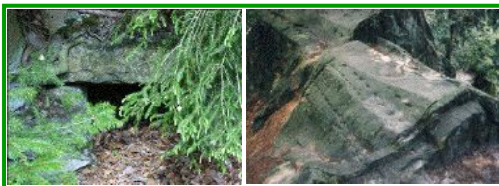
Fontaine rebaptisée Jacobsquelle... & Lignes de la Pierre Sacrée