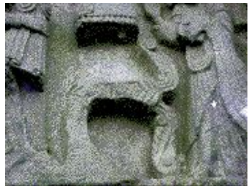
Le bas-relief en 1935 et détail de l'Irmisul "agenouillé"

« Dans les Externsteine, il existait une salle de mesures astronomiques* dont il ne reste plus que la façade avec une lucarne : dans l'alignement de celle-ci, une aiguille de bronze indiquait les périodes cultuelles par l'ombre portée sur le mur opposé. L'arrière de cette salle, avec son mur si précieux du point de vue archéologique, fut détruit sur les ordres de l'évêque Alcuin : la pose de coins de bois mouillés permit à ses sbires de faire éclater la roche.