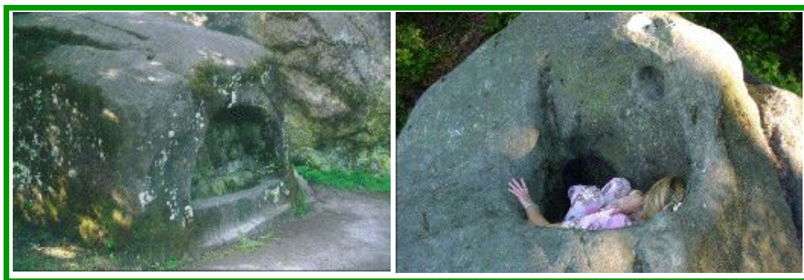
Le tombeau initiatique & le “trou aux femmes” (fécondité)