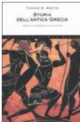
Storia dell'antica Grecia. Origini e segreti di una civiltà, Thom. R. Martin, Newton/ Compton 2004