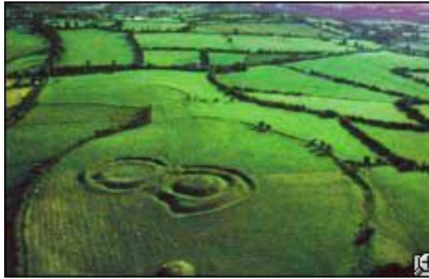
La Colline de Tara en Irlande

Vu à la Télé GB le 21 novembre dans "L'Histoire non résolue" :